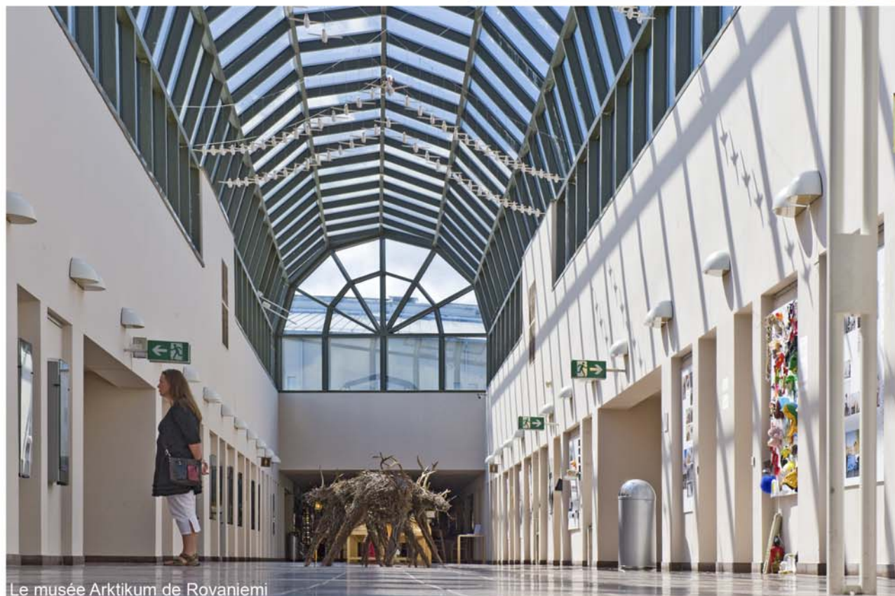
Le musée Arktikum de Rovaniemi