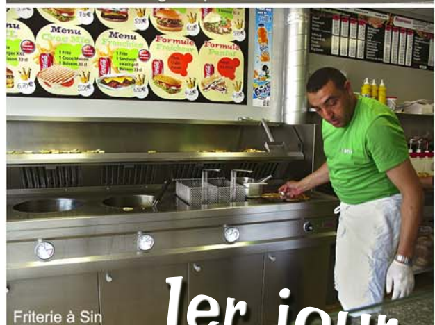
Friterie à Sin