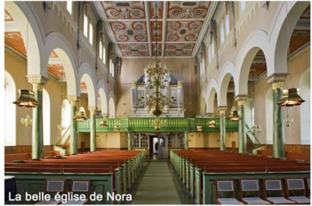
La belle église de Nora