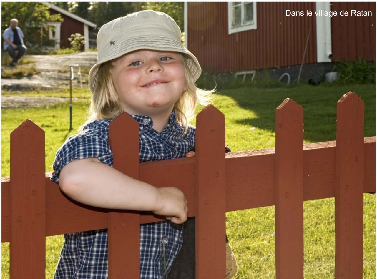
Dans le village de Ratan