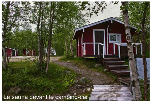
Le sauna devant le camping-car