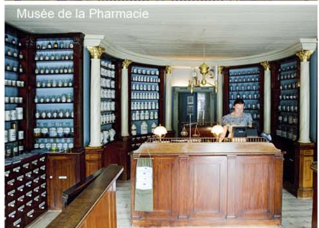
Musée de la Pharmacie