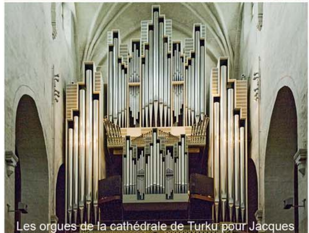
Les orgues de la cathédrale de Turku pour Jacques