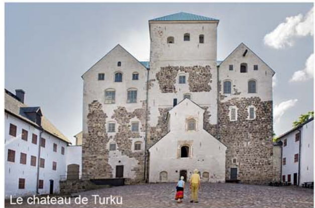
Le chateau de Turku