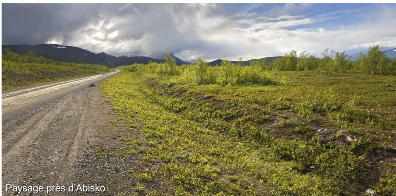
Paysage près d'Abisko

A une centaine de kilomètres de Kiruna, et 30 km avant la frontière norvégienne, nous nous arrêtons au bord du grand lac Torneträsk à Abisko, station de sport et de randonnée au bord d'un parc naturel : «Abisko National Park». Le camping est fermé. Nous dormons sur un parking très au calme.