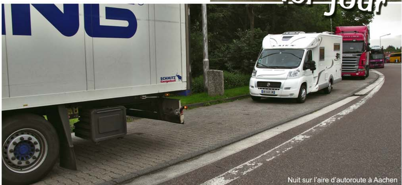
Nuit sur l'aire d'autoroute à Aachen