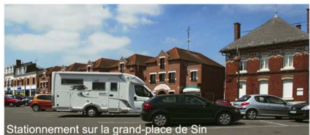
Stationnement sur la grand-place de Sin

La nuit sera tranquille mais le sommeil en pointillé à cause du bruit incessant de la circulation autoroutière.