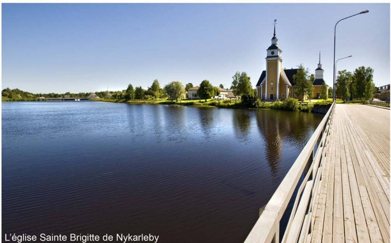
L'église Sainte Brigitte de Nykarleby