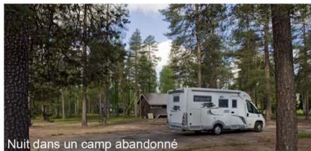
Nuit dans un camp abandonné

Nous reprenons la route pour Ranua à 80 km au sud de Rovaniemi, pour le zoo arctique. nous passons la nuit dans le sympathique camping du zoo.