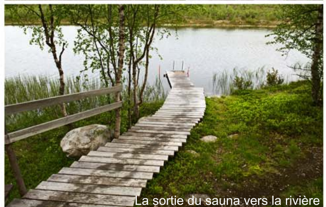
La sortie du sauna vers la rivière