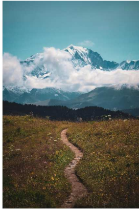
Face au Mont Blanc

Le chemin guide l'oeil dans la photo. Belle image. Les couleurs sont complémentaires.