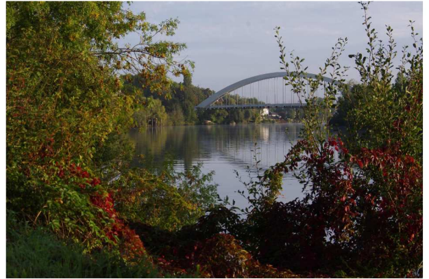
Pont de Saint Pierre

La végétation est trop présente. Un recadrage permettrait de se recentrer sur le sujet ou bien il aurait fallu se déplacer sur la gauche lors de la prise de vue.